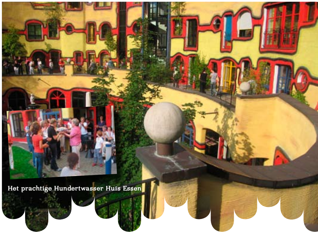
Het prachtige Hundertwasser Huis Essen

Na een lichte lunch in een restaurant aan de Baldeneysee wandelden we de achterliggende heuvel op, waar Villa Hügel ligt. Een kolossale villa van een beroemde industriële familie. We kregen een rondleiding door het gebouw en werden op de hoogte gebracht van de geschiedenis. Daarnaast was er een magnifieke schilderijtentoonstelling, waar onze kunstkennis nog wat werd bijgespijkerd. Ook het enorme park eromheen was zeer de moeite waard. Er werd genoten, zittend op een bankje, liggend in het gras, of tijdens een klein wandelingetje.