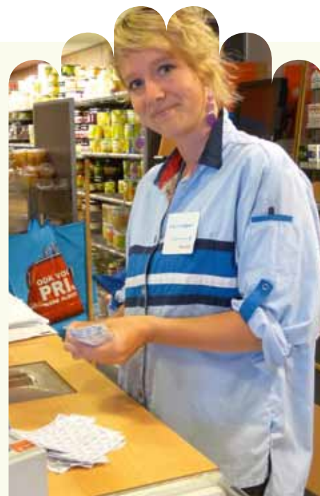
Een medewerker van AH telt de bonnetjes.

De meeste bonnetjes vertegenwoordigen een kleine waarde van € 0,25 tot een paar euro. Maar alle kleine beetje helpen en in de afgelopen maanden is met de actie al meer dan € 3200,- bijeengebracht. Vrijwilligers van het Ronald McDonald Huis gaan met regelmaat langs de filialen om de brievenbussen te legen. Klanten reageren positief. Iemand die normaal te weinig geld overhoudt om goede doelen te steunen, vond dat ze via deze statiegeldactie wel kon doneren. 'Want flessen kocht ze sowieso en dat je het statiegeld niet terug krijgt, merk je eigenlijk niet'. Ook medewerkers van Albert Heijn dragen hun steentje bij. Zo doen ze in het filiaal aan de Vondellaan gevonden emballagebonnen ook in