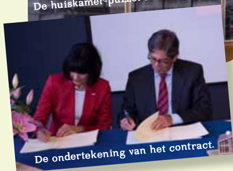
De ondertekening van het contract.