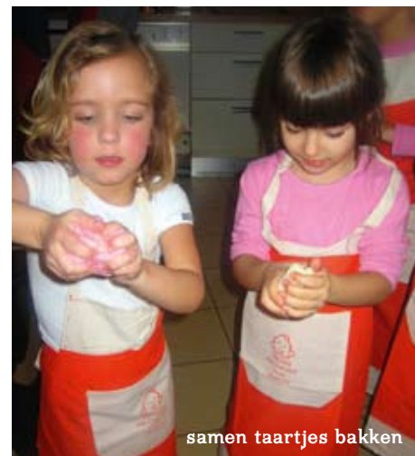
samen taartjes bakken