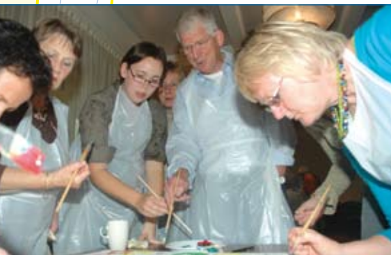
Druk aan het schilderen tijdens het uitje van 2007