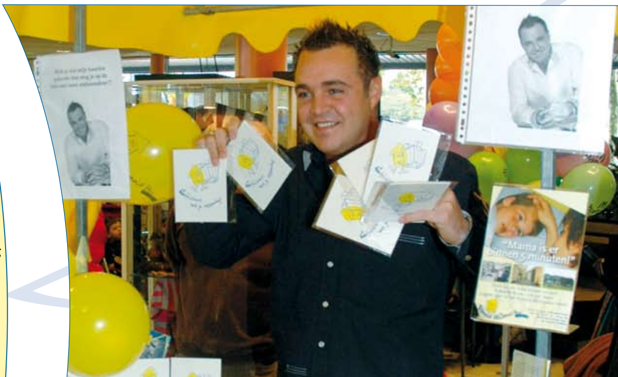
Grad Damen tijdens de verkoop van ansichtkaarten voor het Ronald McDonald Huis Tilburg.

Concept/realisatie: RAL Reclame-adviesbureau B.V.