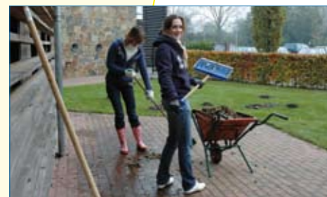
Medewerkers van Rabobank Tilburg pakken de tuin aan in het kader van Make A Difference Day

De medewerkers van Rabobank Tilburg grepen de landelijke Make A Difference Day (MADD) aan om een handje te helpen in Ronald McDonald Huis Tilburg. De tuin had een grote beurt nodig en dus togen de Rabobank-medewerkers op donderdag 30 oktober naar het Tilburgse Huis. Er werden plantjes en boompjes verzet, graszoden verlegd en bladeren opgeruimd. Ook werd er druk geschoffeld. Met veel enthousiasme werden er bergen werk verzet. De medewerkers waren het er allemaal over eens: een dagje 'buiten' werken is heerlijk en zeker voor herhaling vatbaar.