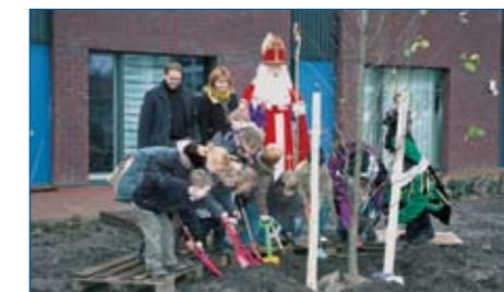
Onder toezicht van Sinterklaas plantten de buurtkinderen bomen bij het Phoenix-complex, geholpen door Zwarte Pieten

met speciale spades de grond te verplaatsen. Na afloop kregen de kinderen allemaal een leuk cadeautje van de Sint voor het helpen.