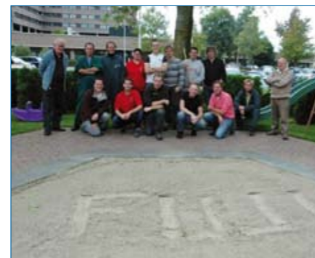
Medewerkers van FUJIFILM bij de door hen opgeruimde parkeerplaats van Huis Tilburg

Medewerkers FUJIFILM: heel erg bedankt voor deze gezellige dag, met een prachtig opgeruimd resultaat, en wat het huismanagement betreft 'GRAAG weer tot volgend jaar!'