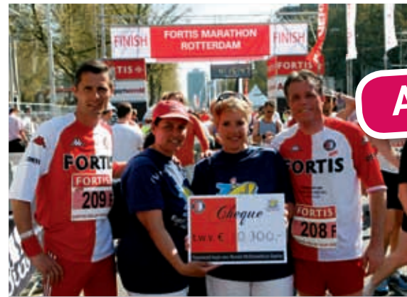
Overhandiging van het symbolische bedrag bij de finish van de marathon