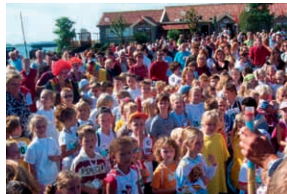
Kinderen in actie voor de KinderOmloop

De omloop op het eiland Goeree-Overflakkee is een jaarlijks terugkerend evenement. Een prestatiewandeloctocht van 110 kilometer, af te leggen binnen 24 uur. Ieder jaar wordt er een goed doel uitgekozen waar alle sponsorgelden naartoe gaan. De organisatie heeft dit jaar voor de nieuwbouw van Ronald McDonald Huis Sophia Rotterdam gekozen. Op 24-25 augustus zal dit evenement plaatsvinden en wij hopen uiteraard dat veel mensen zich aanmelden dit jaar! Loopt u ook mee? www.omloop.com