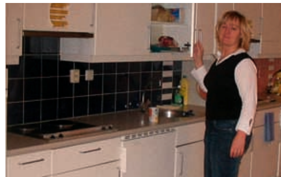
Moeder van Kim in het Huis.

Inmiddels heeft Kim in mei een nieuw hart gekregen.