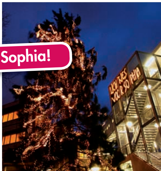
de kerstboom t.b.v. de lichtjesactie op de bouwplaats van het nieuwe Ronald McDonald Huis.