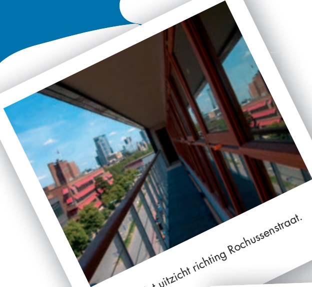
18 juni: Het uitzicht richting Rochussenstraat.