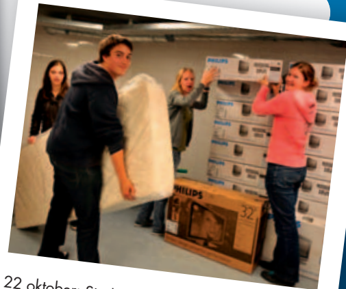
22 oktober: Studenten helpen bij het neerzetten van alle nieuwe spullen.