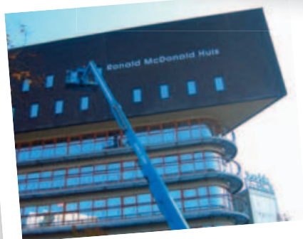
13 oktober: Blinkende letters maken duidelijk waar dit gebouw voor dient!