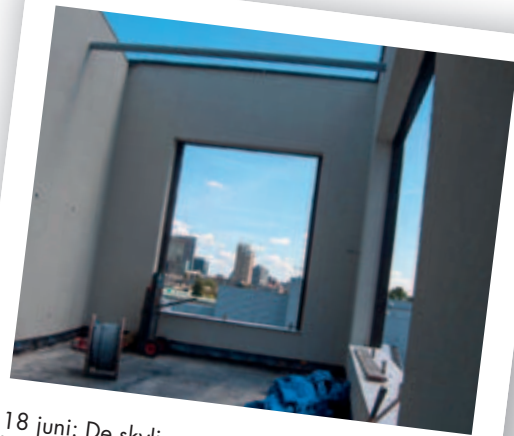
18 juni: De skyline van Rotterdam gezien vanaf het dakterras.