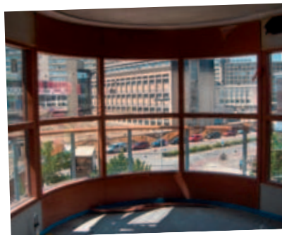
18 juni: Het uitzicht vanuit een van de gastenkamers.