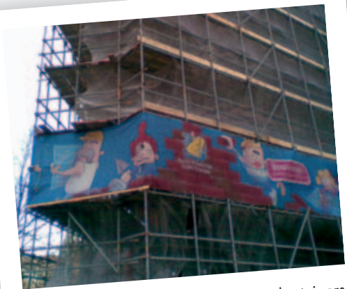
11 maart: Een vrolijk bouwboek siert de steigers van het nieuwe Huis.