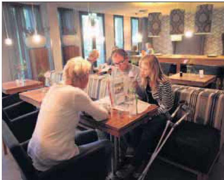
De gezellige eetkamer van het Huis.