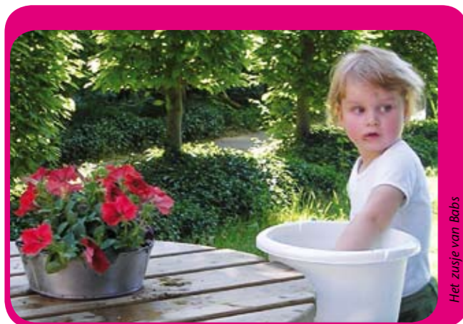
Het zusje van Babs