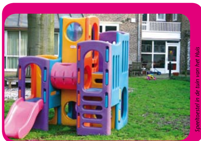
Speeltoestel in de tuin van het Huis