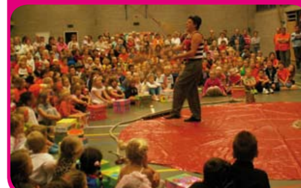
Beelden van de feestweek