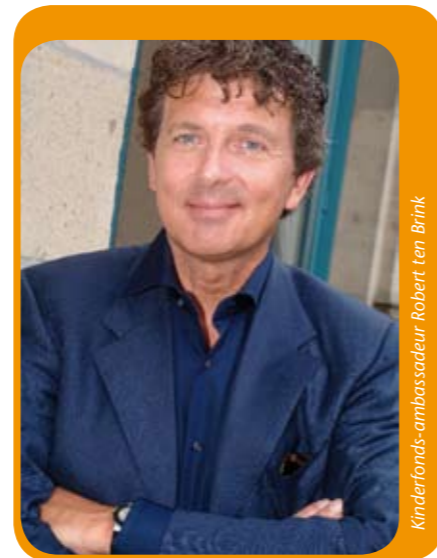
Kinderfonds-ambassadeur Robert ten Brink

Op woensdag 4 juni zond RTL 4 de eenmalige Ronald McDonald Surprise Show uit, naar het idee van de ontroerende Surprise Show van Henny Huisman waarin mensen werden verrast met hun droomwens die werkelijkheid werd. In de Ronald McDonald Surprise Show, een initiatief van het Ronald McDonald Kinderfonds, zetten zieke of gehandicapte kinderen iemand met wie ze een bijzondere band hebben opgebouwd in het zonnetje. Daarbij werden ze geholpen door bekende Nederlanders waaronder presentatrice Barbara Barend, kunstenaar Ans Markus en judokampioen Dennis van der Geest. De show werd gepresenteerd door Kinderfonds-ambassadeur Robert ten Brink, hij werd bijgestaan door collega-ambassadeur Yvon Jaspers.