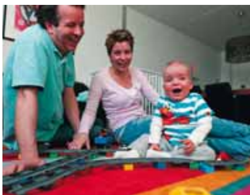
"Gelukkig hoef je niks, een veilige omgeving, dat is genoeg"