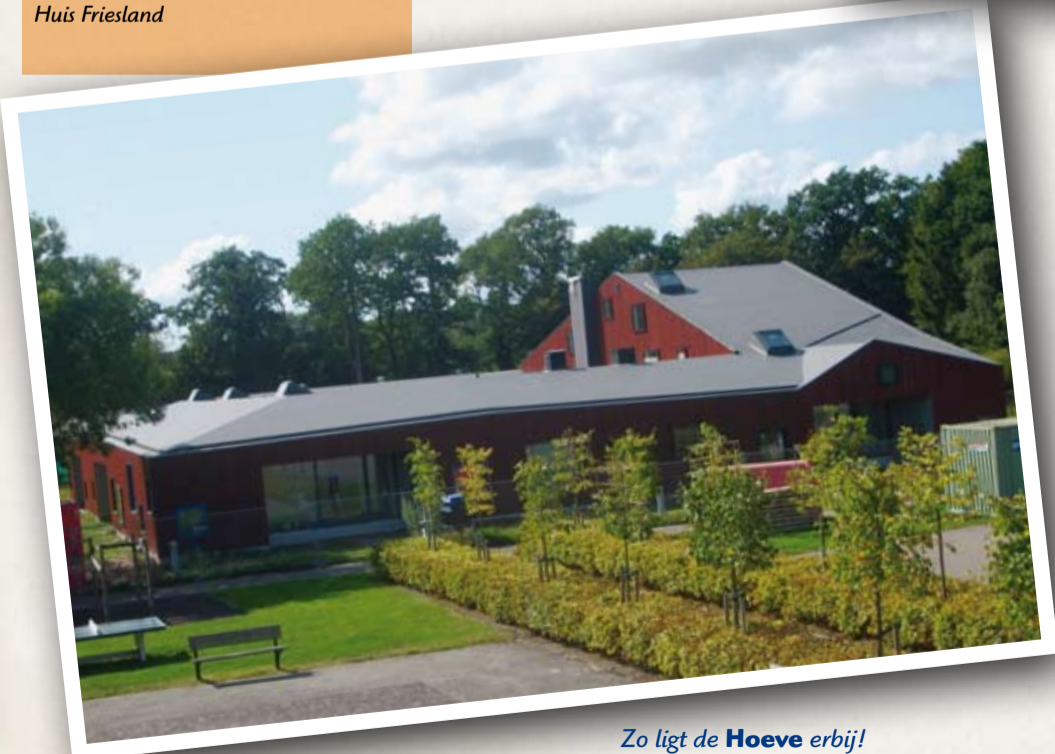
Zo ligt de Hoesve erbij!

De speelzolder is een uitstekende plek om te 'chillen': er liggen grote zitkussens en er is genoeg plek om spellen te doen, te lezen of te gamen.