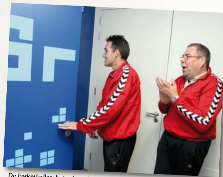
De basketballers betreden nieuwsgierig het eerste vakantieappartement.

De kop is eraf: de Hoeve is in gebruik! In het voorjaar volgt de officiële opening, die op feestelijke wijze de komst van de tweede Ronald McDonald Vakantielocatie markeert