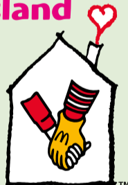
RONALD McDONALD HUISKAMER FRIESLAND

Op 4 juni is op feestelijke wijze Ronald McDonald Huiskamer Friesland geopend. De Huiskamer is gerealiseerd op de kinderafdeling van het Medisch Centrum Leeuwarden. In de Huiskamer kunnen ouders met een kind dat behandeld wordt op de afdeling even ontsnappen aan de ziekenhuisfeer en tot rust komen in een huiselijke omgeving. Ouders kunnen er overdag een krantje lezen, televisie kijken of hun mail even checken. Voor veel ouders is de Huiskamer naast een rustpunt, ook een ontmoetingsplek waar ze in contact komen met andere ouders. We zijn er trots op te kunnen vertellen dat Ronald McDonald Huiskamer Friesland volledig is gesponsord door bedrijven, fondsen en instellingen!