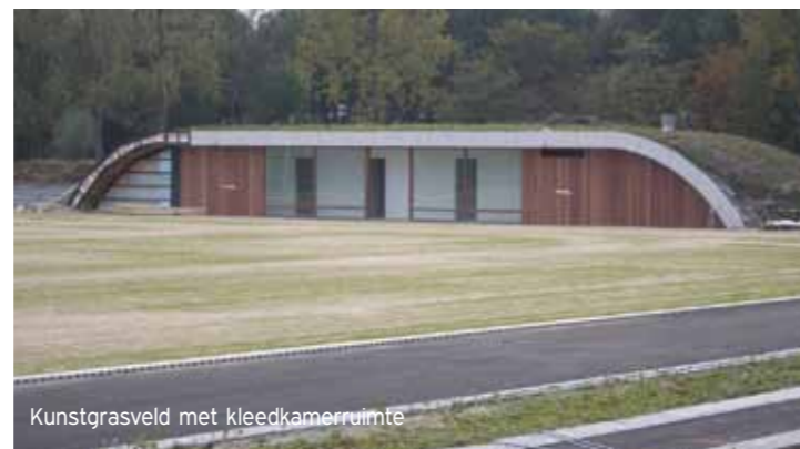
Kunstgrasveld met kleedkamerruimte