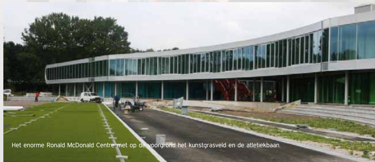
Het enorme Ronald McDonald Centre met op de voorgrond het kunstgrasveld en de atletiekbaan.

Weverwijk Schilders BV voerde met plezier het complete schilderwerk in het Ronald McDonald Centre uit. Een enorme klus die het betrokken schildersbedrijf met beide handen aangreep. Weverwijk Schilders vertrouwt er op dat de toekomstige sporters jarenlang zullen genieten van en in het 'schilderachtige' Centre.