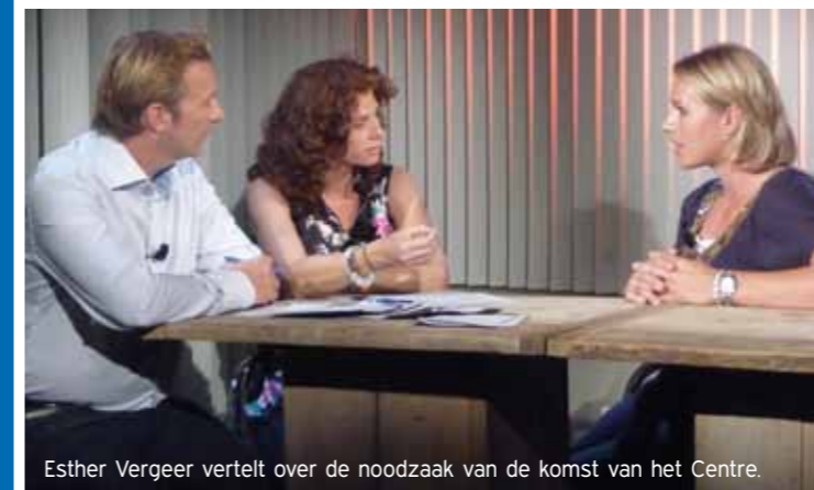
Esther Vergeer vertelt over de noodzaak van de komst van het Centre.