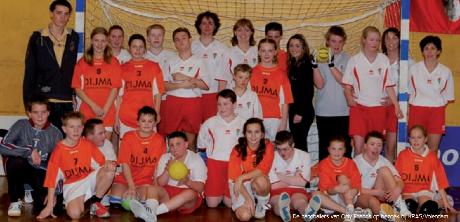
De handballers van Only Friends op bezoek bij KRAS/Volendam