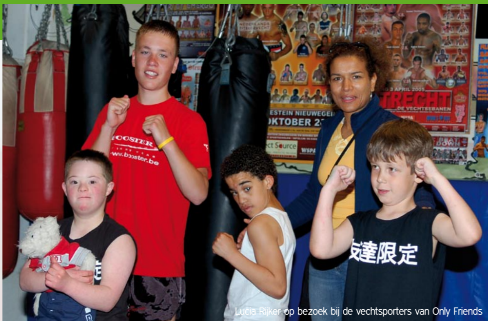
Lucia Rijker op bezoek bij de vechtsporters van Only Friends