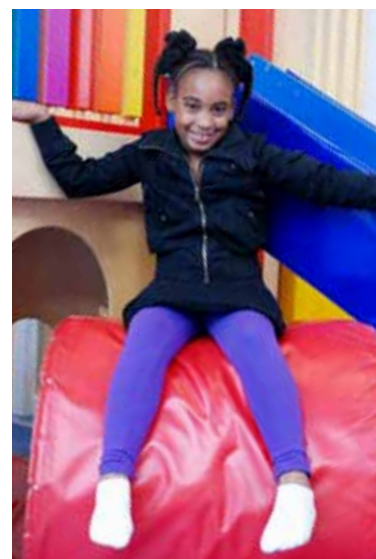
Marshery speelt dag in dag uit op de Daktuin